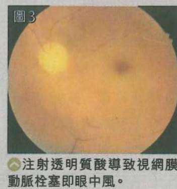
圖3 注射透明質酸導致視網膜動脈栓塞即眼中風。

3個月) 消滅。另外，身體在注射多次及大量肉毒桿菌後會產生抗體，導致以後的注射要加劑量，甚至沒有效果。