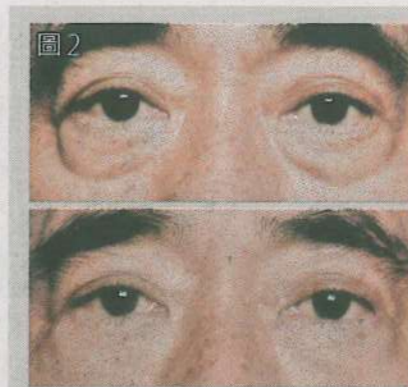
圖2 注射透明質酸可處理眼袋及淚溝。

在眼部周圍注射肉毒桿菌素有可能影響淚腺而形成眼乾。此外，肉毒桿菌素有機會意外地放鬆了提瞼肌、控制眼球活動的肌肉或控制眼瞼開合的環眼肌等，造成眼眉、眼皮下垂、視線有重影或眼瞼外翻等問題。可幸，這些副作用一般都在肉毒桿菌素失效後 (若2至